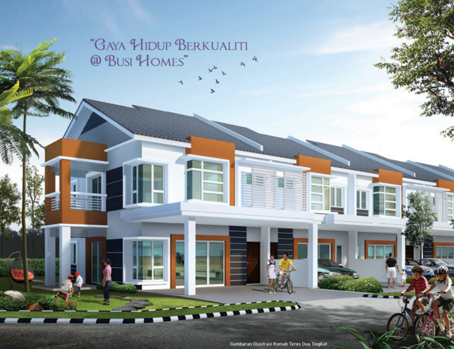
Gambaran Ilustrasi Rumah Teres Dua Tingkat