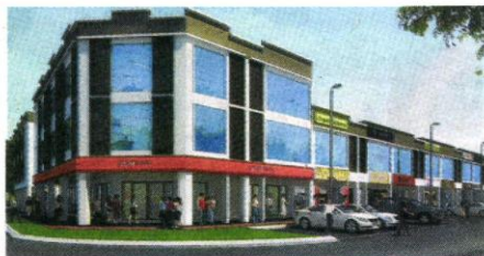
新设计的商舖符合时下商家需求。