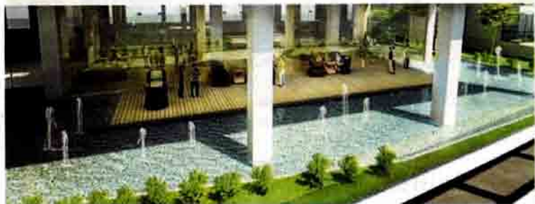
了解购买者需求的发展商，为 Parc 服务公寓设计了两层的休闲区。