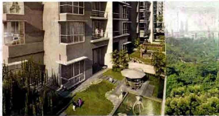
半独立式单位设计，让住户享受迷人的 180 度窗外全景。

将在今年 5 月向市场推介的 Parc 服务公寓，售价介于 30 万 5800 至 74 万 5800 令吉，或每平方米售价为 301 至 334 令吉。